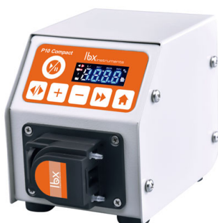
FOTO DEL PRODOTTO