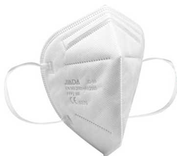
FOTO DEL PRODUCTO